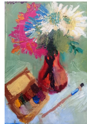
Рисунок Лейлы Горбовской, 4Б