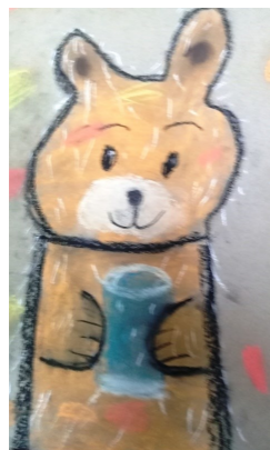
Рисунок Ивашенковой Виктории, 25